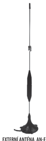
EXTERNÍ ANTÉNA AN-E