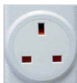
RFRP- 20/B: British