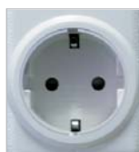
RFRP- 20/S: Schuko