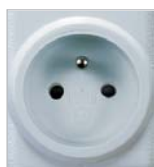
RFRP- 20/F: French